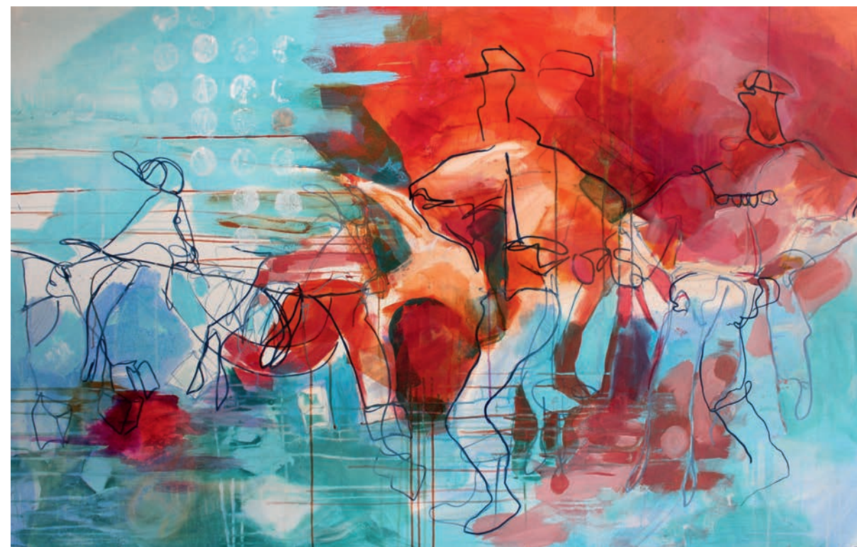
Was was a Fremde? · 100 x 160 cm · 2020