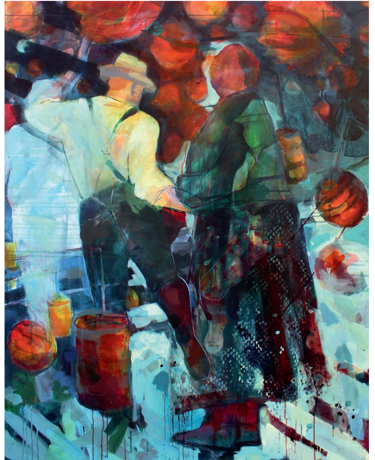
Blümchenmuster und Musterburschen 2 · 150 x 120 cm · 2020