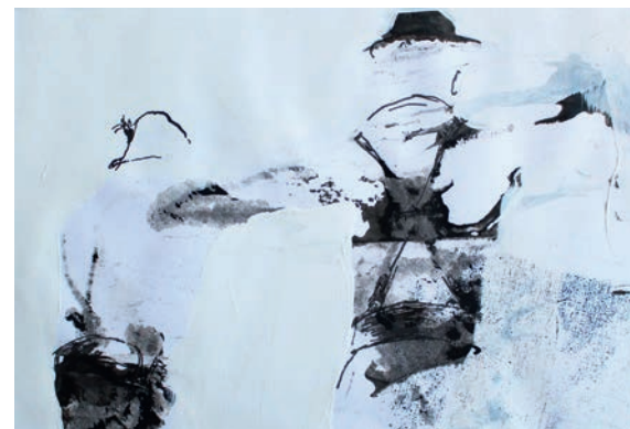
Kleinformatige Schuhplattler · 14,8 x 21 cm