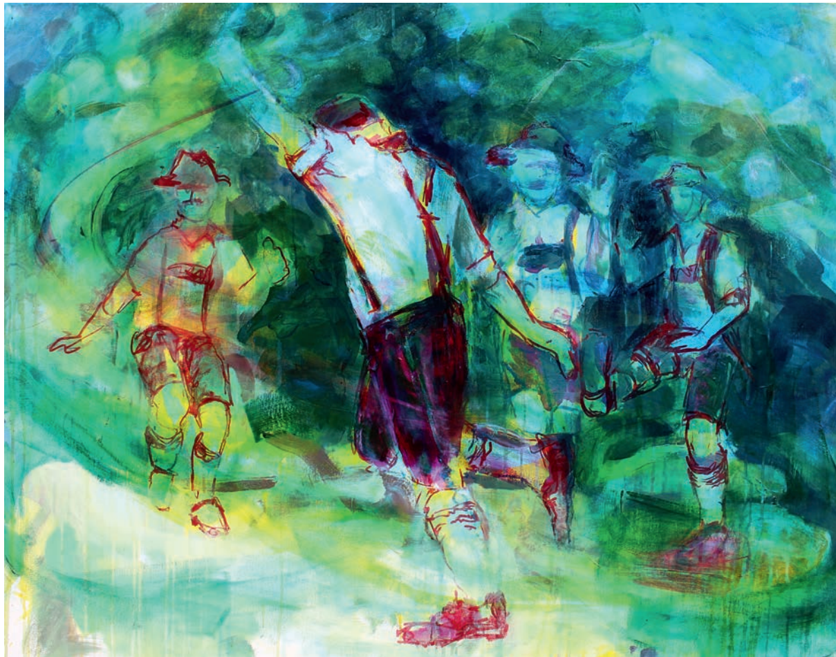
Discobauer · 100 x 120 cm · 2021