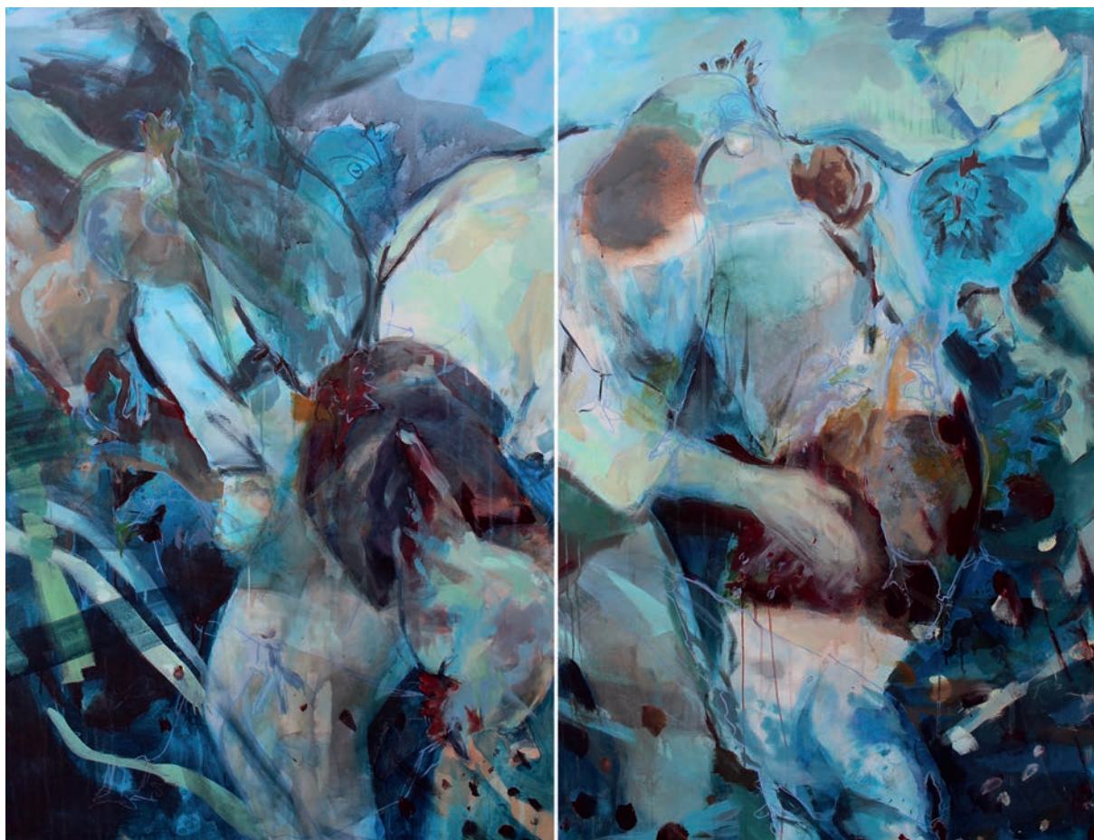
Platter und Hackordnung · 120 x 160 cm · 2020