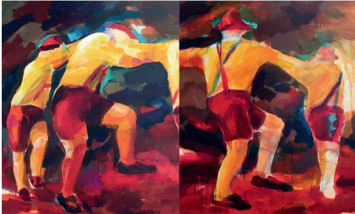
Schuhplattler Diptychon 3 · 70 x 120 cm · 2017