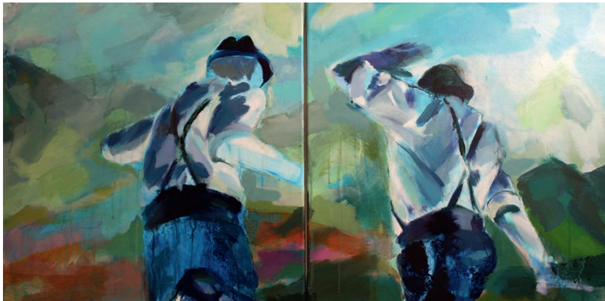
Schuhplattler Diptychon 1 · 60 x 120 cm · 2017