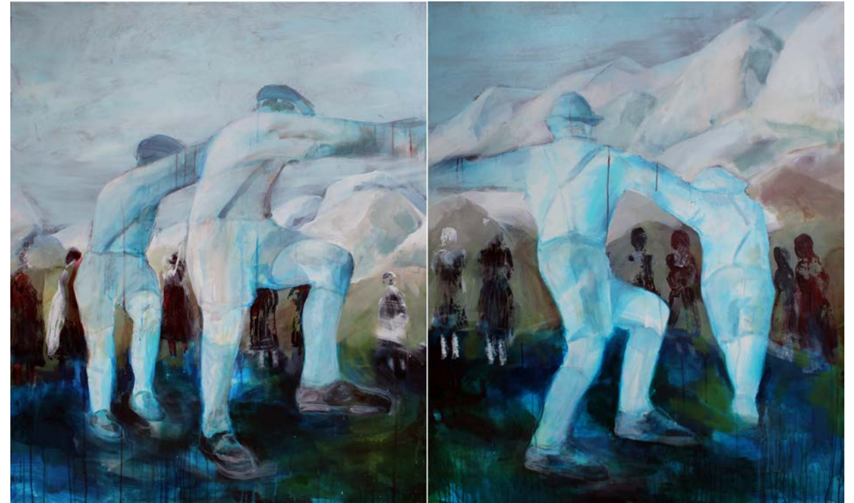
Schuhplattler Diptychon 5 · 120 x 200 cm · 2018