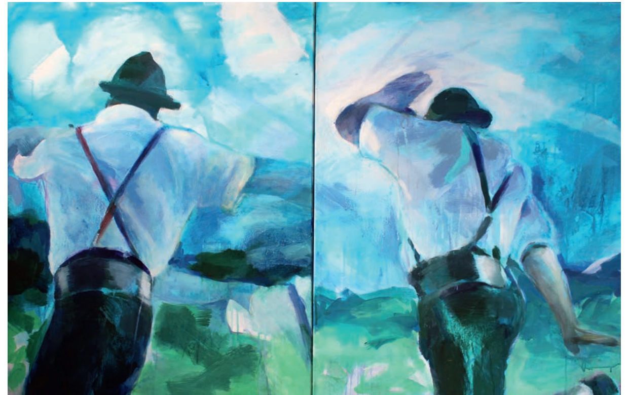
Schuhplattler Diptychon 4 · 90 x 140 cm · 2017